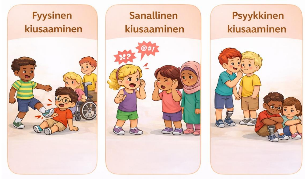
(Kuva luotu tekoälyllä)

Kiusaaminen voi ilmetä monin tavoin ja sitä voidaan jaotella fyysiseen, sanalliseen ja psyykkiseen kiusaamiseen.