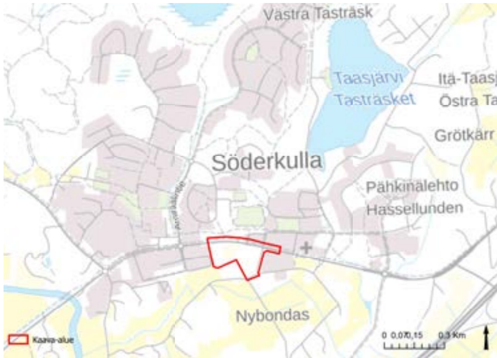
Kaava-alueen sijainti kartalla. Planens läge på kartan.

Detaljplaneområdet ligger i Söderkulla centrum i södra Sibbo, längs Nya Borgåvägen (lv 170). Planeringsområdet ägs av Sibbo kommun i sin helhet. Planeringsområdet omfattar i huvudsak ett icke detaljplanerat område och delvis ett detaljplanerat område. Planområdets areal är cirka 2,4 ha. Planområdets gräns kan preciseras under fortsatt planering.