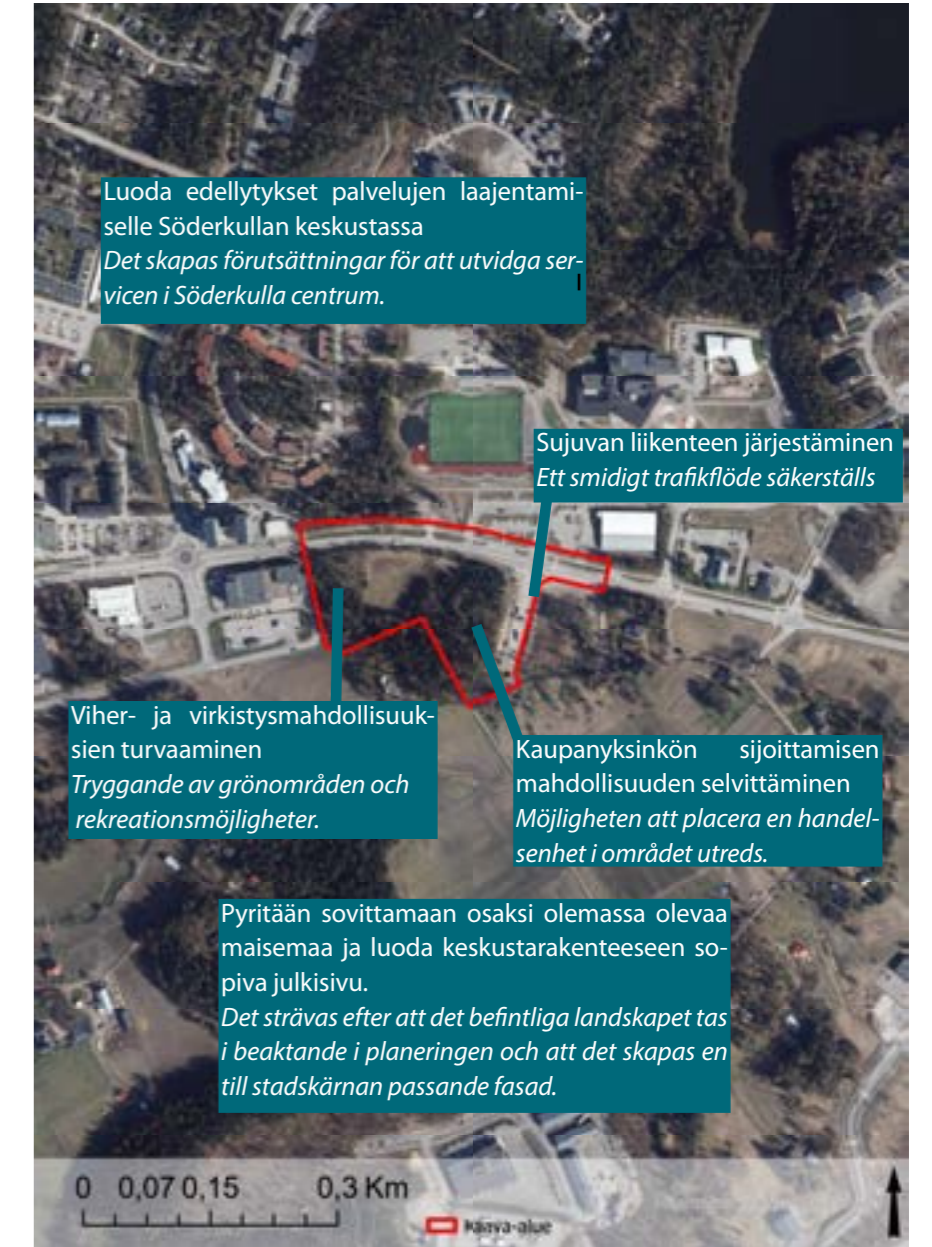
Kaavan alustavat tavoitteet. Planens preliminära mål.

Målet med detaljplanen är att utveckla Söderkulla centrum och tätortsfunktioner. I enlighet med innehållskraven för detaljplaner i 54 § i lagen om områdesanvändning strävar planen efter att skapa förutsättningar för en hälsosam, fungerande och trivsam livsmiljö, för regional tillgång till service och för reglering av trafiken.