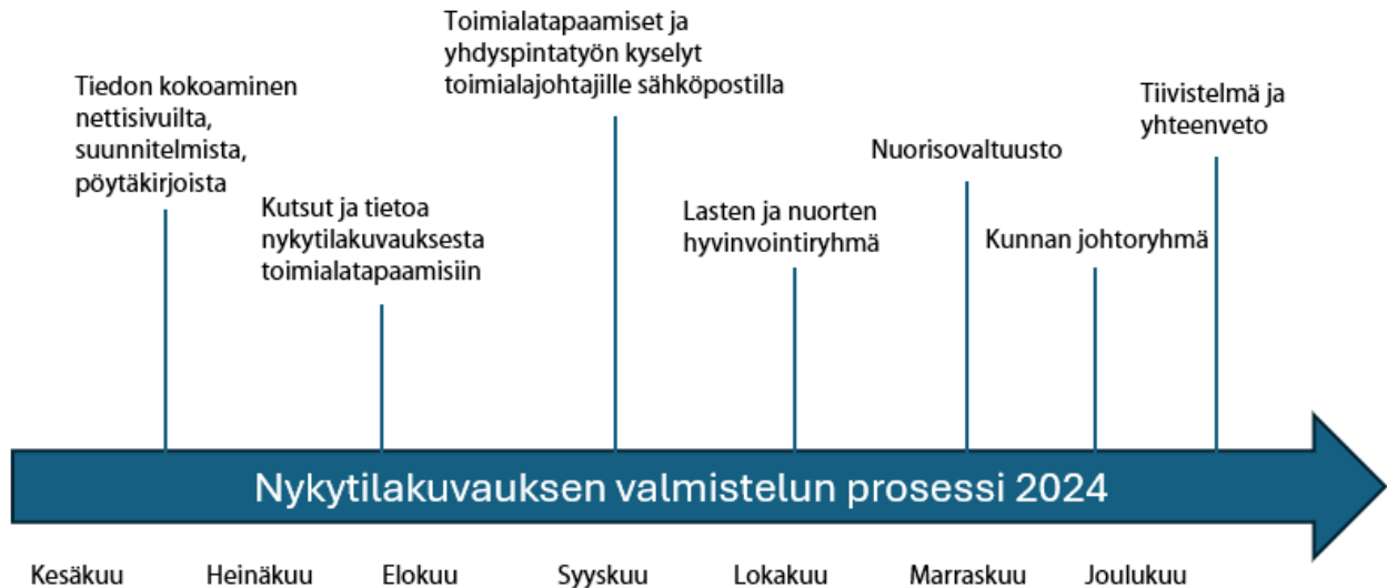
Kuva 1 Nykytilakuvauksen valmistelun prosessi

Nykytilakuvaus koottiin kesä-joulukuun 2024 aikana kuvassa yksi näkyvän prosessin mukaisesti.