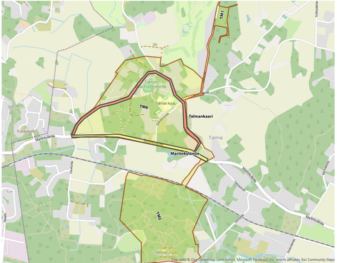
Talman alueen hankkeet