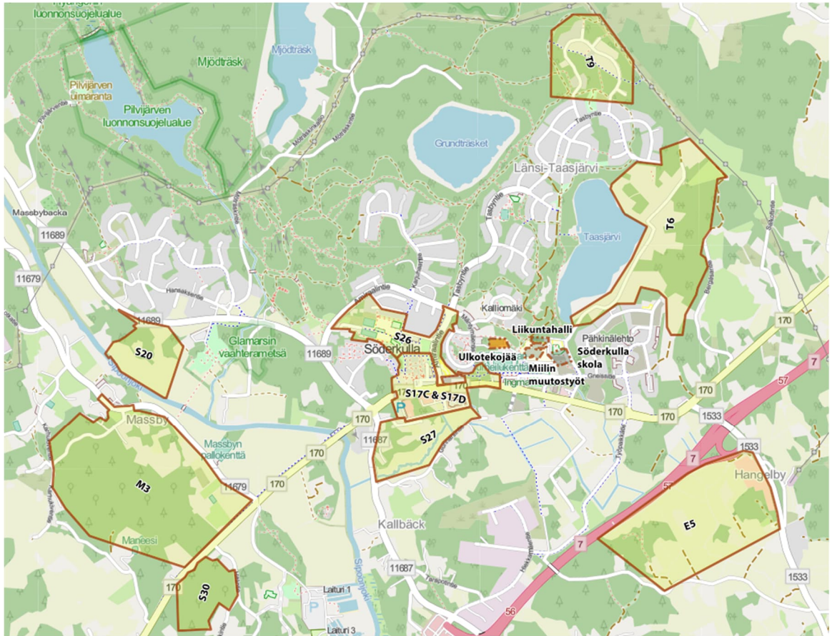
Söderkullan alueen hankkeet