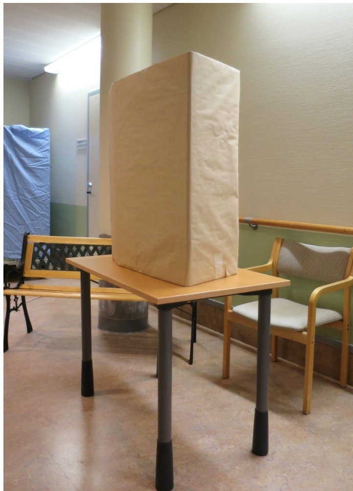
Kuva 6. Vaalisalaisuuden säilymistä turvaava sermi Keravan laitosäänestyspaikalla

Tarkastuksen toimittajien havaintojen mukaan äänestyspaikalla pöydälle asetettu sermi oli riittävä turvaamaan vaalisalaisuuden säilymistä äänestystilanteessa.