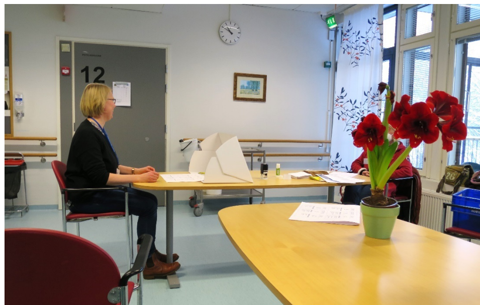
Kuva 2. Suora näköyhteys käytävältä äänestyspaikalle

Äänestyspaikka oli vuodeosaston päiväsalissa, joka oli tähän tarkoitukseen riittävän tilava ja äänestyshetkellä rauhallinen. Äänestyspaikka oli sijoitettu ongelmallisesti pöydän päähän siten, että äänestäjän takaa oli mahdollista kulkea ja äänestystilaan saapuvilla oli suora näköyhteys äänestyspaikkaan. Takaapäin ja sivusta oli mahdollista havainnoida, kun äänestäjä tarkasteli ehdokaslistaa ja teki merkinnän äänestyslippuun. Tarkastuksen toimittajien käsityksen mukaan äänestyspaikan epäonnistunut sijoittelu saattoi jossain tilanteessa vaarantaa vaalisalaisuuden säilymistä.