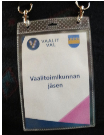
Kuva 5. Keravan vaalitoimikunnan jäsenen tunnistelappu

Tarkastuksen toimittajien havaintojen mukaan äänestyspaikalla pöydälle asetettu sermi oli riittävä turvaamaan vaalisalaisuuden säilymistä äänestystilanteessa.