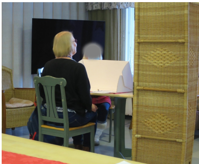
Kuva 1. Suora näköyhteys ovelta äänestyspaikalle

Tarkastuksen toimittajat pitivät äänestyspaikan sijoittelua ongelmallisena. Havaintojen mukaan äänestyspaikan takaviistossa olevasta ovesta, josta tultiin sisään äänestystilaan, oli suora näköyhteys äänestyspaikalle. Takaapäin pystyi ainakin äänestäjän tietämättä havainnoimaan, kun äänestäjä tarkasteli ehdokaslistaa. Tilanteesta ja äänestäjän toimintakyvystä riippuen suora näköyhteys voi olla mahdollinen myös pöydälle, jossa äänestysmerkintä tehtiin äänestyslippuun. Tarkastuksen toimittajien käsityksen mukaan äänestyspaikan epäonnistunut sijoittelu saattoi jossain tilanteessa vaarantaa vaalisalaisuuden säilymistä.