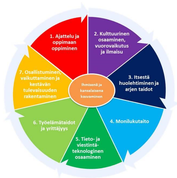
Kuva: Laaja-alainen osaaminen

Perusopetuksen aikana oppilaat pohtivat menneisyyden, nykyisyyden ja tulevaisuuden välisiä yhteyksiä sekä erilaisia tulevaisuusvaihtoehtoja. Heitä ohjataan ymmärtämään omien valintojen, elämäntapojen ja tekojen merkitys paitsi itselle, myös lähiyhteisöille, yhteiskunnalle ja luonnolle. Oppilaat saavat valmiuksia sekä omien että yhteisön ja yhteiskunnan toimintatapojen ja -rakenteiden arviointiin ja muuttamiseen kestävästä tulevaisuudesta rakentaviksi.